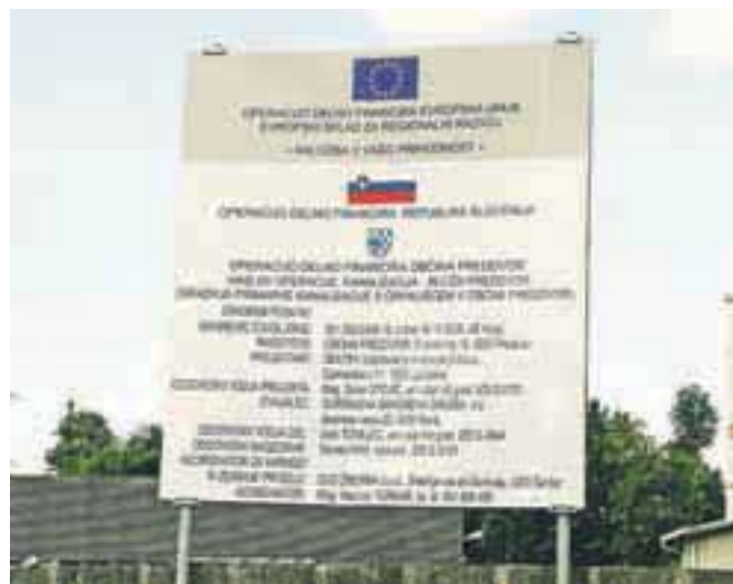
Tabla, ki v Preddvoru označuje gradnjo kanalizacije in čistilne naprave

del za celotno operacijo 2,1 milijona evrov brez DDV, vendar zaradi razmer na trgu gradbeništva kaže, da bomo projekt oddali izvajalcem za malo manj kot 1,7 milijona. Od tega je Občini Preddvor uspelo pridobiti 566.591 evrov iz Evropskega sklada ter 318.154 evrov iz državnega proračuna po 21. členu zakona o financiranju občin. Projekt bo potekal v dveh proračunskih letih, končan mora biti do septembra 2014.